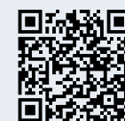
Sentier didactique du glacier

Se promener futé, découvrir le Valais autrement!