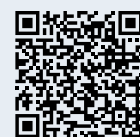
Sentier ludique de la Creusaz